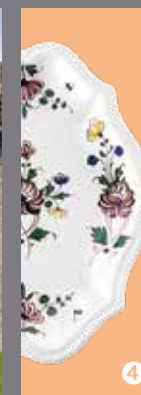
Musée de Samadet