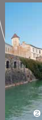
Monastère de Sorde-l'Abbaye