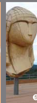
Dame de Brassempouy