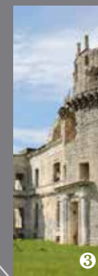
Château de Bidache